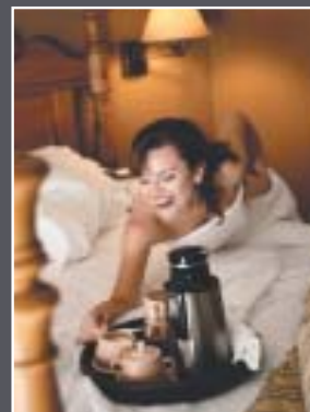
Accessori per Hotel Hotel Accessories